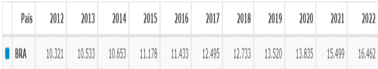
FIGURA 2 – Números de suicídio em cada ano de 2012 a 2022