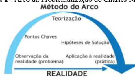
Figura 1 - Arco da Problematização de Charles Maguerez

O Arco de Maguerez (figura 1) engloba esse contexto ao dispor de cinco fases embasadas na realidade observada, teoria objetivada pelo estudo e como ocorre esta aplicação dentro da realidade proposta na evolução do processo de criação de uma liga Acadêmica.